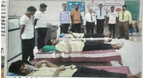
ஓசூர் பி.எம்.சி. டெக் பாலிடெக்னிக் கல்லூரியில்

முகாம் இரத்த தான முகாம் வசத்துமார் சிறப்பு விருந்தினராக கலந்து கொண்டனர், முகாமில் கிருஷ்ணகிரி அரசு இரத்த வங்கி மருத்துவக் குழு கல்லூரி மாணவர்களிடம் இருந்து 100 யூனிட்கள் இரத்தம் சேகரிக்கப்பட்டு கிருஷ்ணகிரி அரசு மருத்துவக் கல்லூரி